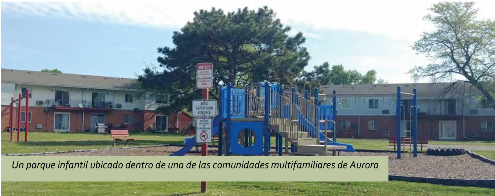
Un parque infantil ubicado dentro de una de las comunidades multifamiliares de Aurora

Las reuniones trimestrales de Metropolitan Mayors Caucus con las Comunidades Colaborativas Apts para Adultos Mayores generalmente incluyen representantes de varias docenas de municipios involucrados en actividades de Envejecimiento en Comunidad y brindan conocimientos temáticos y oportunidades de aprendizaje entre pares. Las experiencias de Aurora con el programa AiaCR durante 2023 serán de interés para otros municipios. La participación en la Colaboración también sirve como un portal a otras actividades regionales sobre el Envejecimiento en Comunidad patrocinadas por una serie de entidades interesadas, como las mesas redondas temáticas bimensuales de la Sociedad Americana sobre el Envejecimiento ( consulte la sección de Recursos para obtener más información ). Aurora también puede desear participar en el Comité de Vivienda y Desarrollo Comunitario de MMC, que aborda la falta de Vivienda Intermedia, el diseño universal y otras consideraciones relevantes sobre el Envejecimiento en Comunidad.