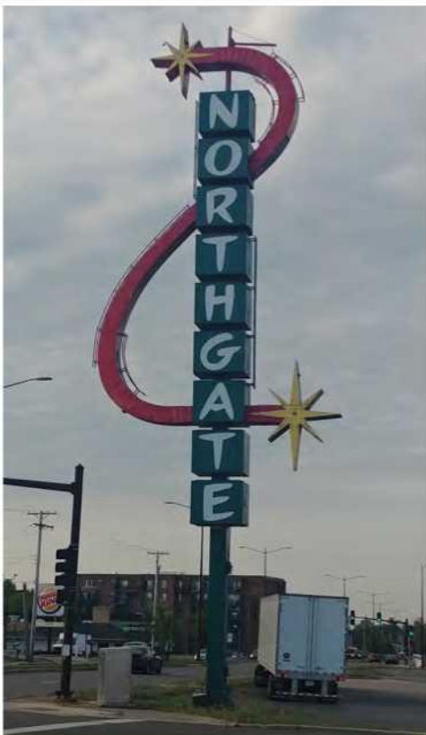
¡Bienvenidos a Aurora!

En cada municipio AiaCR seleccionado, Planificación/ Envejecimiento trabaja con un equipo central autodesignado de personal municipal y partes interesadas asociadas, que toman las decisiones clave sobre cómo se adaptará el programa AiaCR a las circunstancias, objetivos y desafíos específicos de su comunidad.