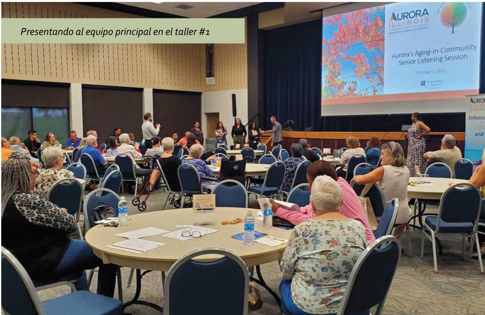
Presentando al equipo principal en el taller #1

Los talleres de AiaCR se diseñaron y presentaron para enlazarse específicamente con el "Senior Listening Tour 2021" y se promovieron en el sitio web de la Ciudad como "Senior Listening Tour 2023" con el lema "Todavía estamos escuchando".