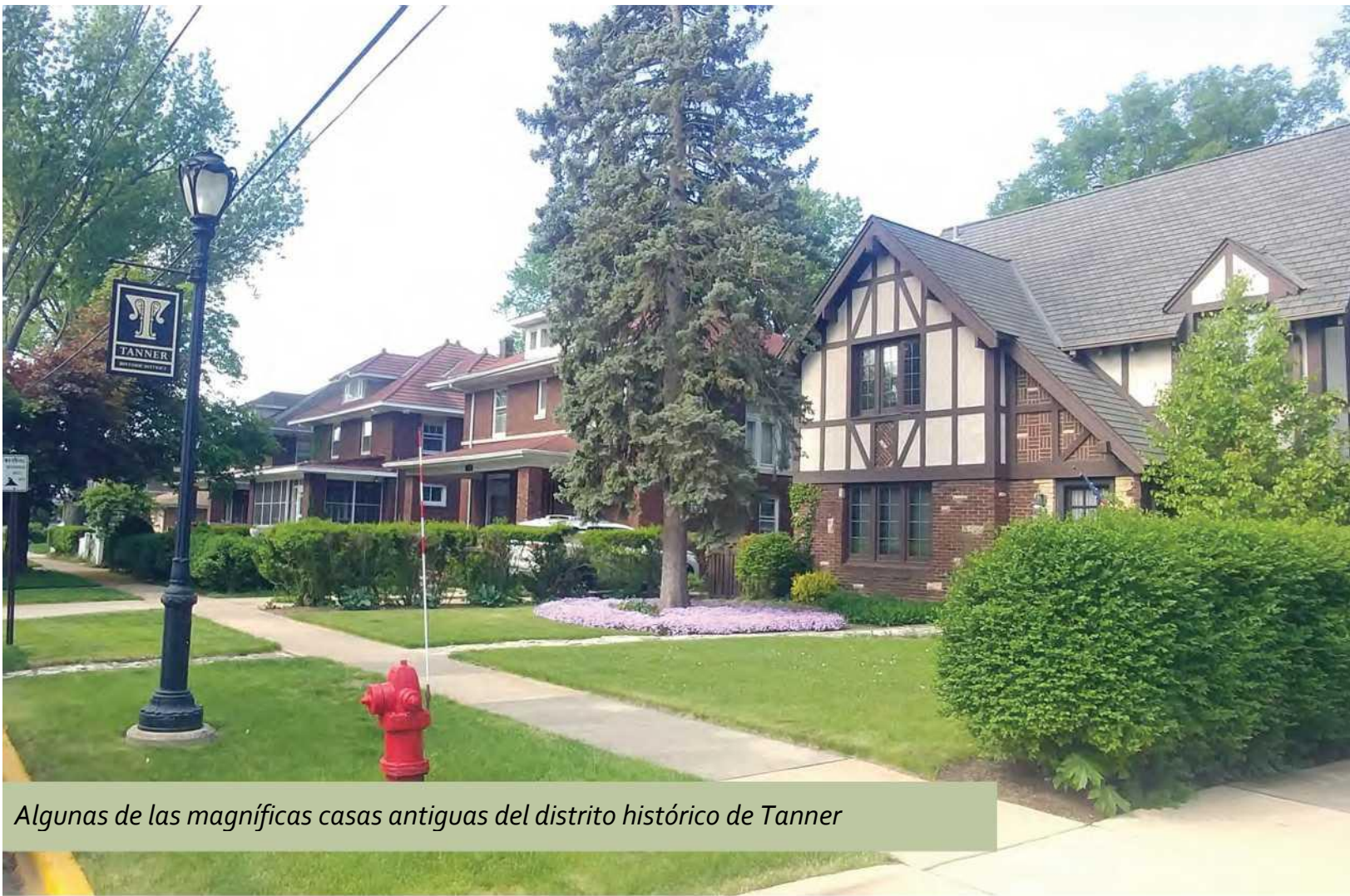
Algunas de las magníficas casas antiguas del distrito histórico de Tanner