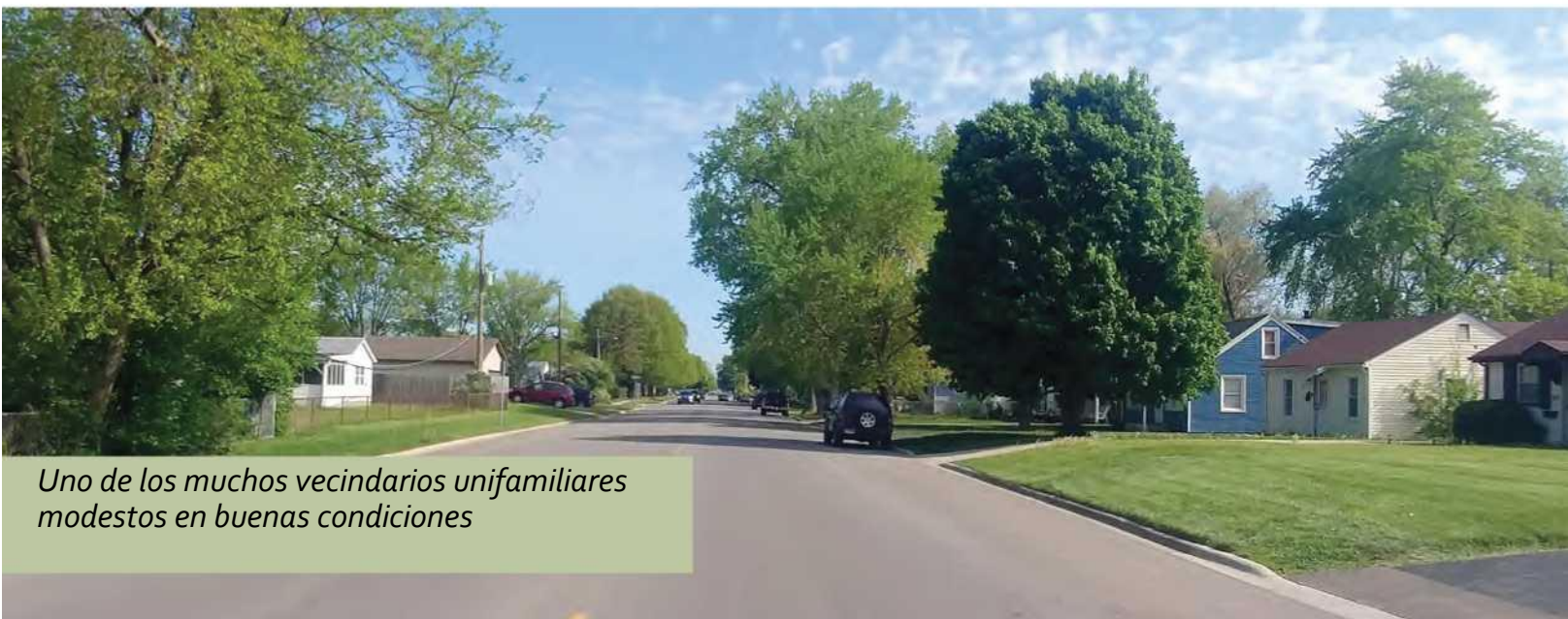
Uno de los muchos vecindarios unifamiliares modestos en buenas condiciones

El Plan Integral de Aurora fue adoptado en 1984 y está bastante desactualizado, y recientemente se ha centrado más en los Planes temáticos y específicos del área, ninguno de los cuales se centra específicamente en el envejecimiento de la población de Aurora y su compromiso con el Envejecimiento en Comunidad. Dado que los Planes Integrales generalmente se actualizan cada 10 a 20 años, Aurora podría desarrollar un Plan Integral actualizado con un enfoque en el Envejecimiento en Comunidad, o podría desarrollar un Plan temático específico para el Envejecimiento en Comunidad. Maneras en que un nuevo Plan Integral puede apoyar el Envejecimiento en Comunidad al incluir estándares de Envejecimiento en Comunidad para proyectos futuros, o al identificar características que podrían agregarse a los vecindarios o distritos comerciales existentes. Ejemplos de Planes Integrales que se enfocan en el Envejecimiento en Comunidad se pueden encontrar en la sección de Recursos.