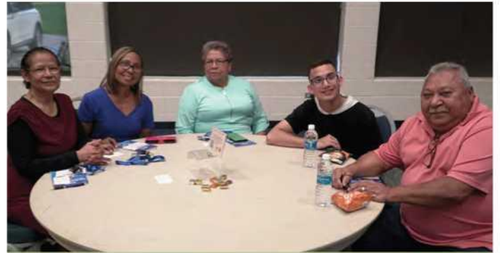
El taller #1 fue bilingüe y dio la bienvenida a todos los asistentes

y discusión, y con intérpretes traduciendo las preguntas al/del español. El equipo central estaba comprometido con que la participación de AiaCR se realizara de manera consistente con la Iniciativa de Diversidad, Equidad e Inclusión (DEI) de la Ciudad. Todos los documentos de compromiso (incluido este) se produjeron y están disponibles tanto en inglés como en español.