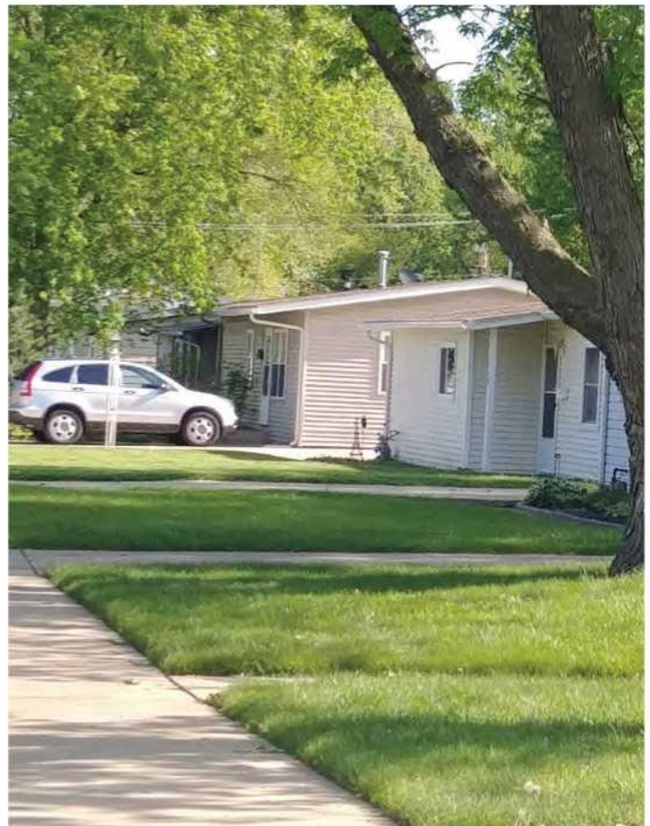
Césped y aceras cuidadas en un barrio unifamiliar

El edadismo es la discriminación contra las personas mayores, a menudo debido a estereotipos negativos e inexactos, y Aurora se compromete a defender la diversidad, la equidad y la inclusión. Así como el antirracismo es la práctica de identificar y oponerse activamente al racismo, el anti-edadismo identifica, denuncia y busca cambiar cualquier elemento que perpetúe las ideas o el comportamiento edadista. Asegurarse conscientemente de que todas las referencias a los adultos mayores de Aurora sean anti-edadistas y caractericen a los adultos mayores como un grupo diverso de activos cívicos y recursos que deben aprovecharse, en lugar de verlos como un grupo monolítico que debe percibirse únicamente a través de una lente médica o basada en las necesidades.