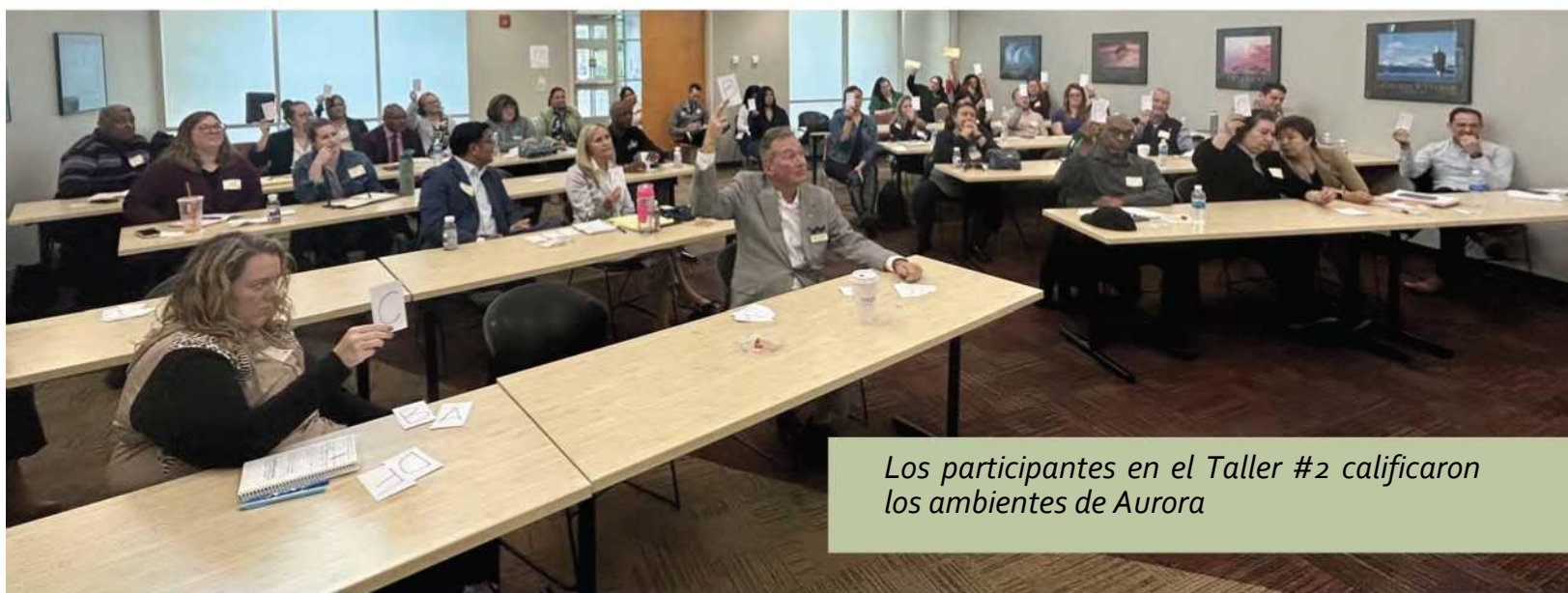
Los participantes en el Taller #2 calificaron los ambientes de Aurora