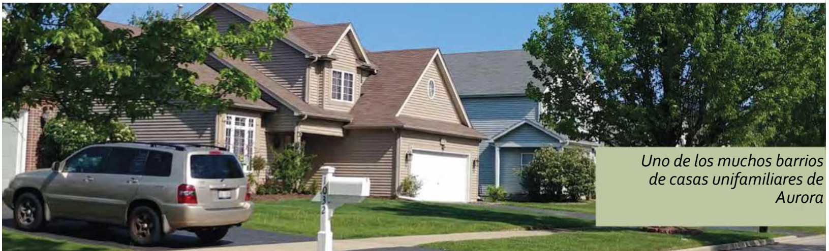
Uno de los muchos barrios de casas unifamiliares de Aurora

Community Data Snapshot (Instantánea de datos de la comunidad) | Aurora (illinois.gov)